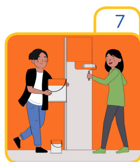
Help the neighbours