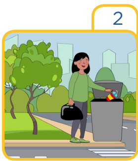
Put the garbage in the trash can