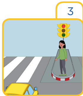
Respect the traffic lights