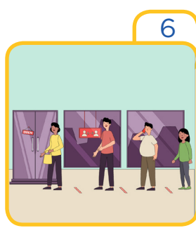
Wait your turn