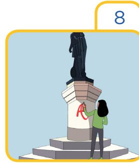
Destroy the monuments