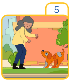
Feed stray dogs