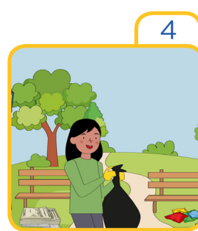
Take care of the environment